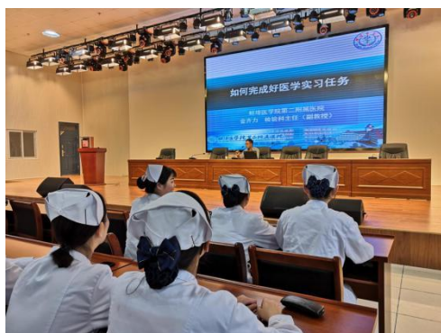
医院专家到校开设讲座

能力；学校制定《教师业务能力提升培训方案》，组织教师开展提高教学业务水平培训，重点抓好提高教师课堂教学能力和信息化教学能力培训工作。2021年学校在做好疫情防控的同时，组织教师开展教学业务能力提升活动，开展实验实训设备使用培训，邀请医院专家到校为师生开设讲座。