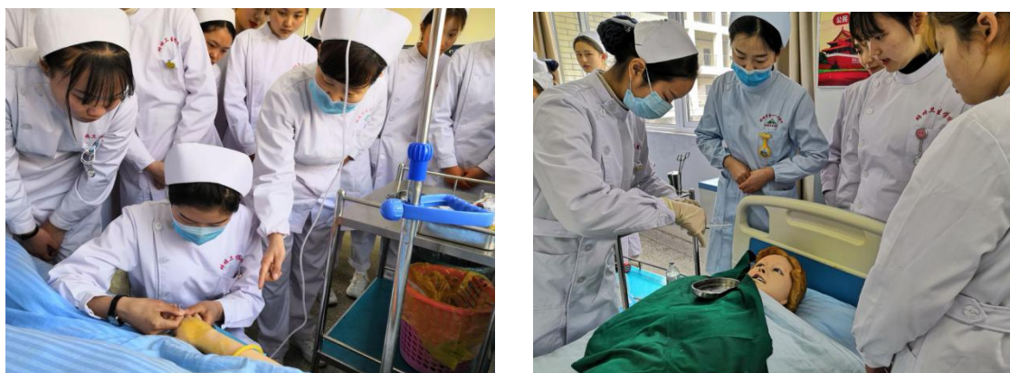
医院带教老师、护士长到校指导学生实训

教学实训工作。与本市和外地共八家医院签订校外实习基地协议，组织学生到这些医院参观开展学习、实验实训和实习。学校和医院合作，组织教师开展校本教材编写和教学资源建设工作。