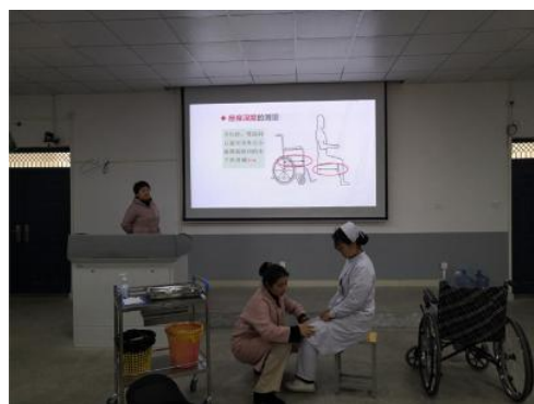
医院专家开展专业技能培训