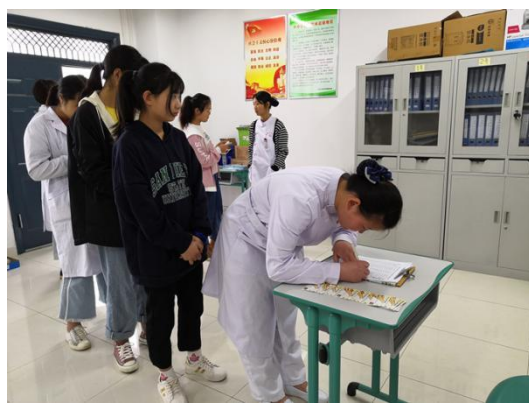
卫校学生在签领资助银行卡