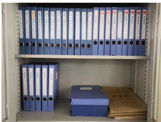
卫校学生资助档案

资助条件的学生，对上报材料提出具体明确的要求，杜绝作假现象，把这件惠及民生的好事办好、办实。学校严格按照国家相关文件要求，所有农村和县镇非农户口学生均享受国家免学费，城市家庭经济困难学生严格按比例执行，并经过班级评议后产生。所有享受国家助学金的学生均进行了困难认定，并经过班级评议后产生。所有享受资助学生的评议、认定、审核工作严格按文件要求规范执行，做到所有符合资助条件的学生全部纳入了资助范围，学生申请材料符合规定要求，学生资助档案有专人负责归档整理，所有档案规范、完整，信息真实，学校各项资金均由教育局结算中心统一管理，资金管理规范，学校有一整套资助资金的发放、使用程序。学校对于全体学生均不收取学费。免学费资金由中央和地方政府承担。